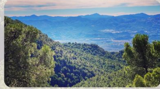
Valle del Almanzora