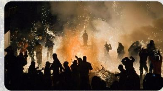
Carretillas. Fiestas patronales