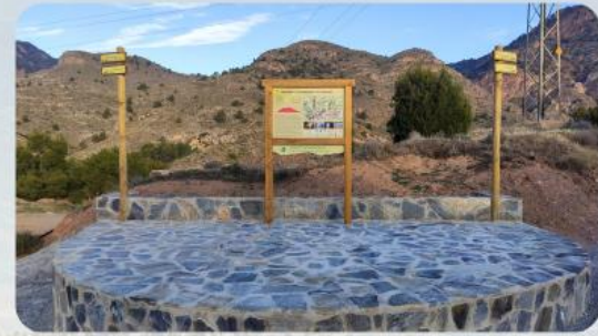
Panel de salida