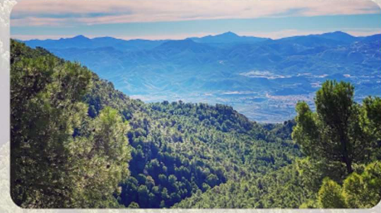
Valle del Almanzora