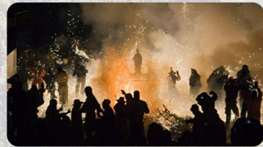
Carretillas. Fiestas patronales