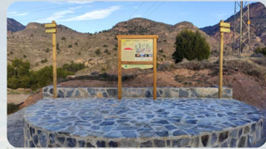
Panel de salida